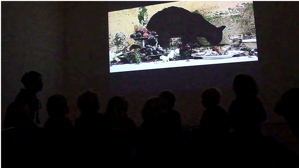
Visning av Bastet