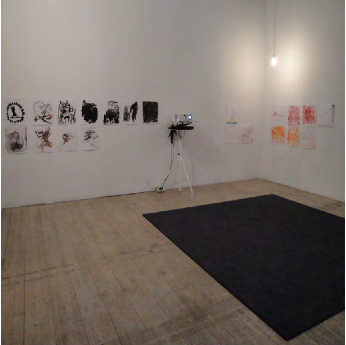
Projektrummet på vernissagen med film och barnens bilder