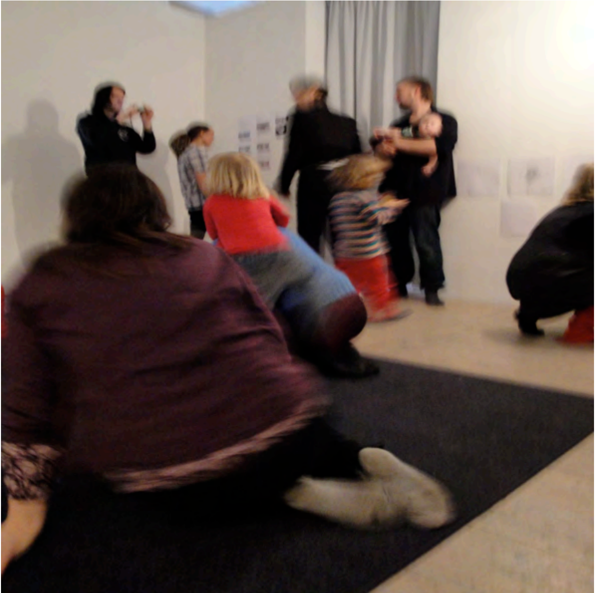
Vernissage med barn, pedagoger, föräldrar och publik