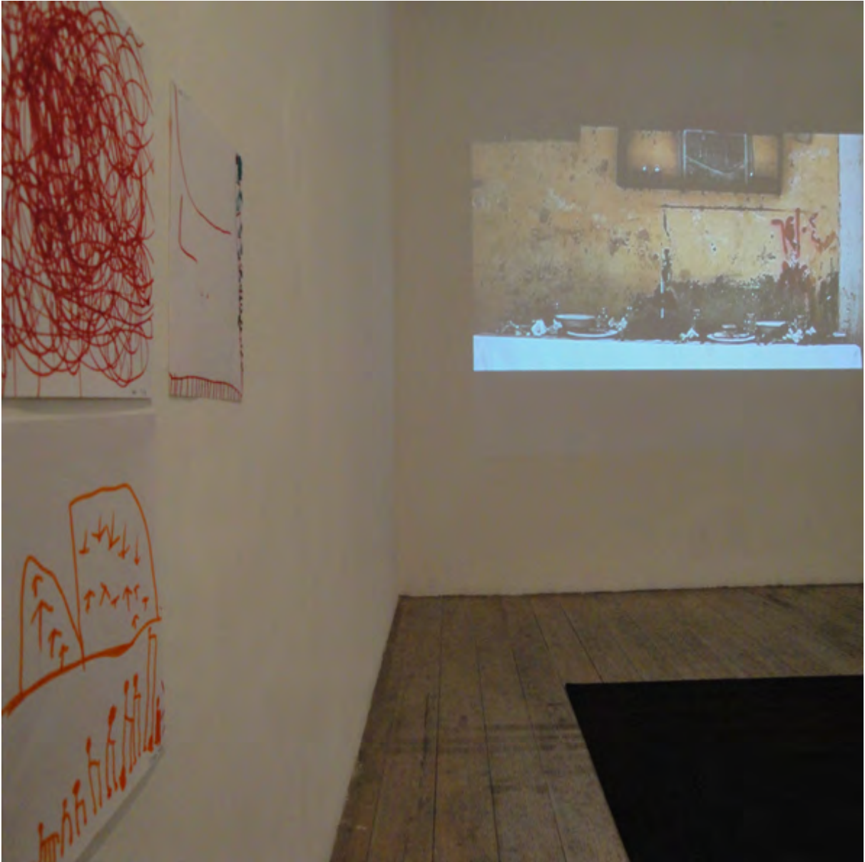
Projektrummet på vernissagen med film och barnens bilder