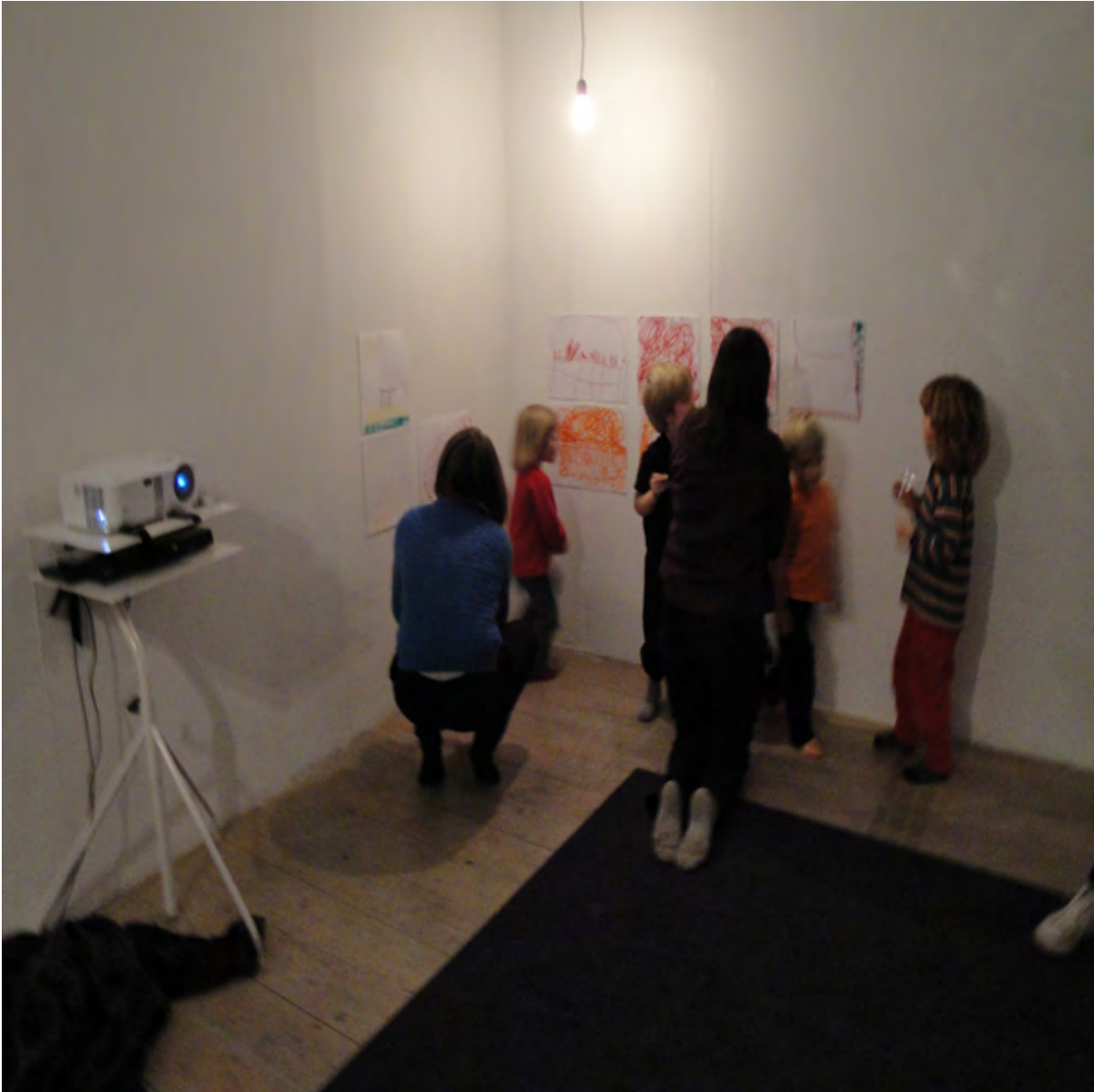
Vernissage med barn, pedagoger, föräldrar och publik